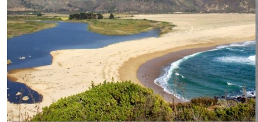
Humedal Desembocadura Río Lluta, Arica