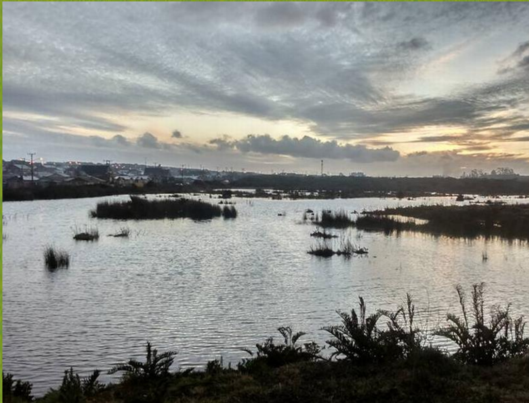
Humedal Llantén, Puerto Montt

Proyecto de ley que “Modifica diversos cuerpos legales con el objetivo de proteger los humedales urbanos”