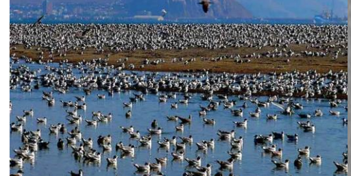
Humedal Tres Puentes, Punta Arenas