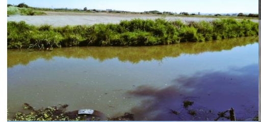
Humedal de Tunquén, Valparaíso