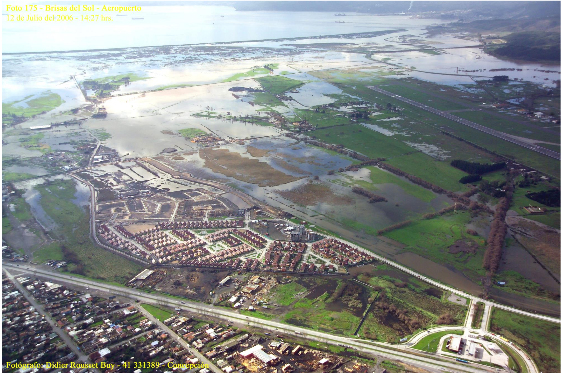
Buy - 41 331389 - Concepción