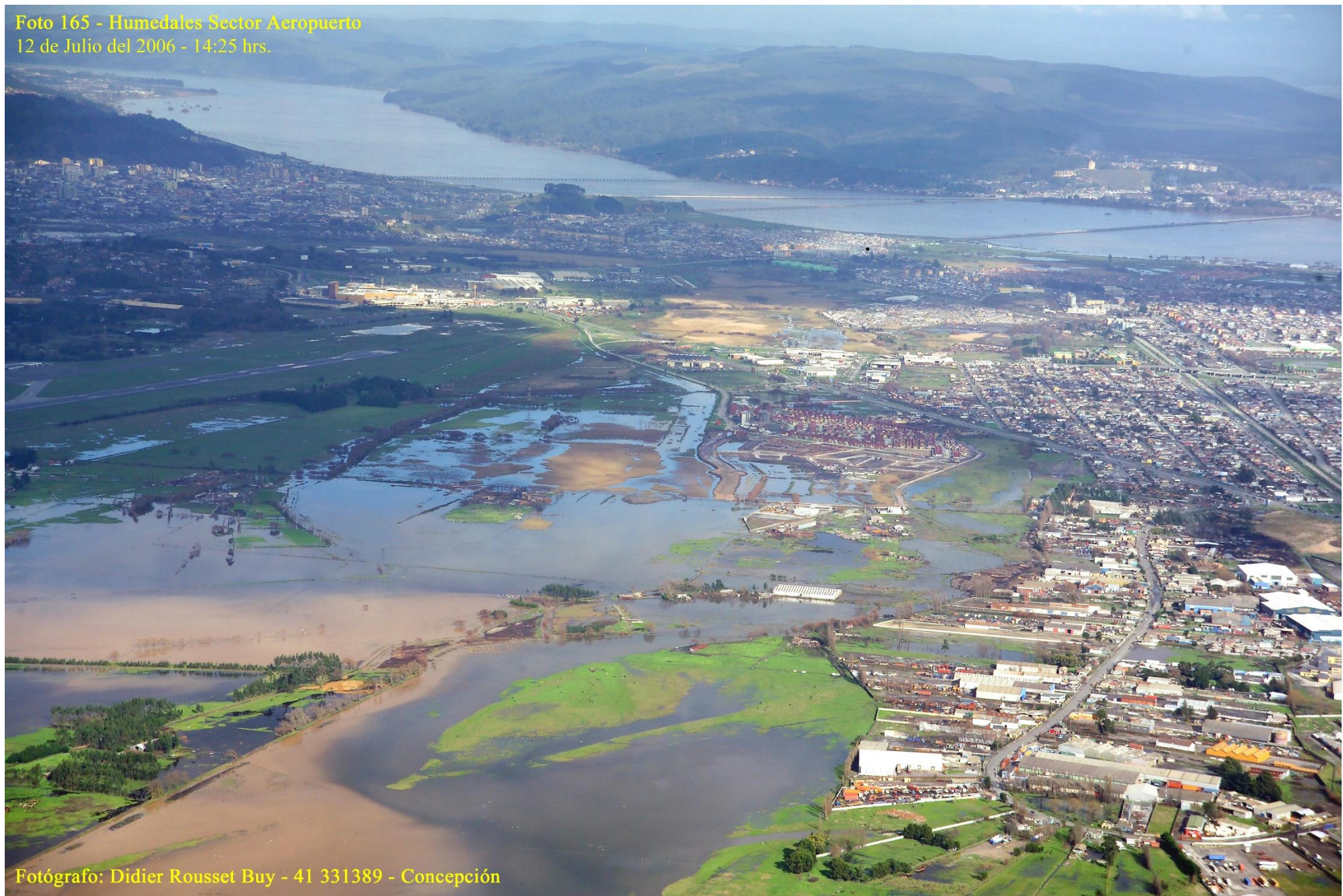
Buy - 41 331389 - Concepción